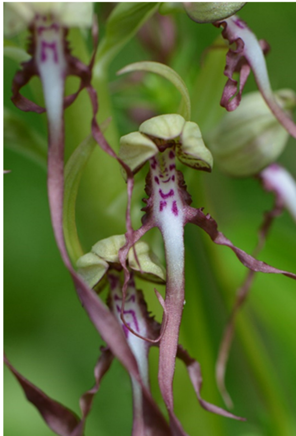
Die Bocks-Riemenzunge kann bis zu einem Meter hoch werden, und der Blütenstand trägt oft zwischen 60 und 100 Blüten. Auffallend ist die stark verlängerte Unterlippe der nach Schafsbock riechenden Blüte.

Kleine und grössere und oft steile Rebparzellen mit Trockensteinmauern, Trockenwiesen, Obstgärten, Hecken, Wäldchen mit Flaumeichen, Felsenheiden und steile Felsen sind mosaikartig über die Reblandschaft entlang des Bielersees verteilt. Die Trockenwiesen und die Felsenheiden werden im Winter hauptsächlich durch die Mitarbeiter des Landschaftswerkes gemäht und entbuscht. Dabei wird immer ein Teil der Fläche stehen gelassen, damit dort die Raupen und Eier der Schmetterlinge oder anderer Insekten überwintern können. Die verschiedenen Landschaftselemente und die Pflegemassnahmen sind die Hauptgründe für die ausserordentliche Artenvielfalt der Pflanzen und Kleintiere.