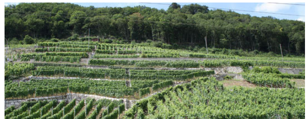
Terrassenanlage in Tüscherz – eine Landschaft, die es zu pflegen gilt.