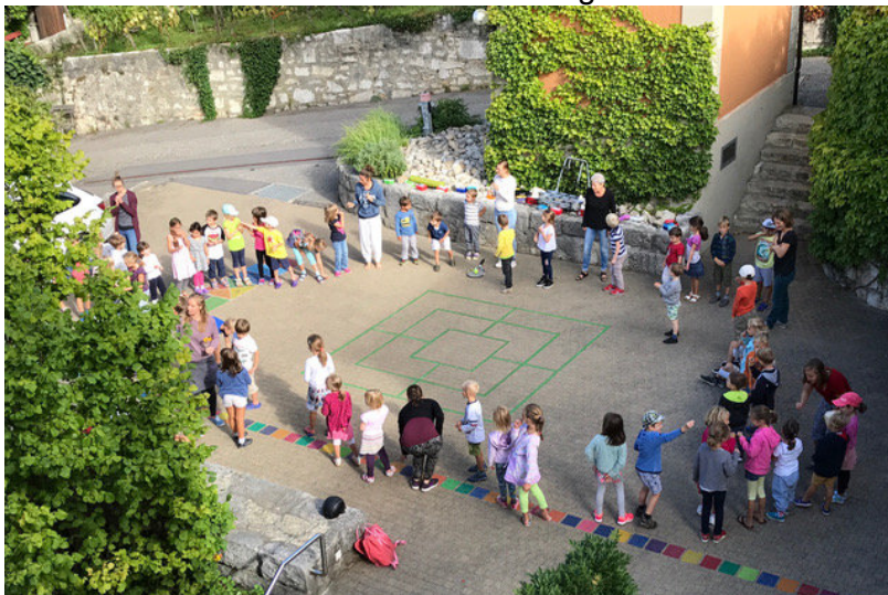
Die Basisstufen Twann und Ligerz beim gemeinsamen „Kennenlern-Morgen“

die Handhabung, den Einsatz, die möglichen Vorteile und Gefahren. So sind wir bereits am Planen einer grösseren Veranstaltung zur Thematik. Wir halten Sie auf dem Laufenden!